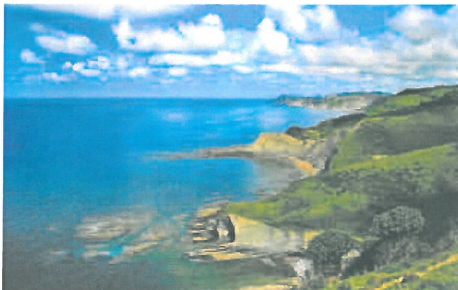
PAISAJES. Muy cerca de la ciudad hay hermosas playas para surfear y descansar.

DESDE LOS AÑOS 90, EL MUSEO GUGGENHEIM, EL DISEÑO Y LA GASTRONOMÍA HAN CONVERTIDO A ESTA CIUDAD DEL NORTE DE ESPAÑA EN UN INTERESANTE PUNTO DE ATRACCIÓN TURÍSTICA