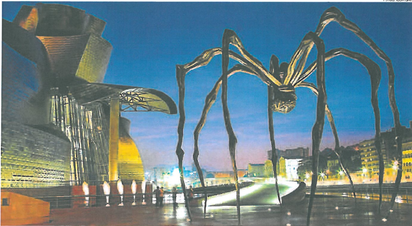
ESCULTURAL. Fachada del impresionante museo Guggenheim diseñado por el famoso arquitecto Frank Gehry. Este centro ha transformado a Bilbao en una importante capital cultural.