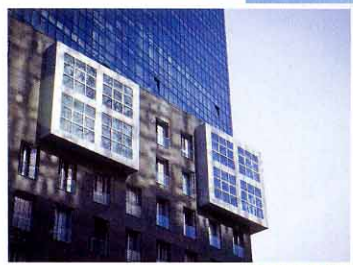
Sopra. Un particolare di Plaza de la Convivencia. A destra. Le torri dell'architetto giapponese Arata Isozaki. Sotto. Il ponte Zubizuri.