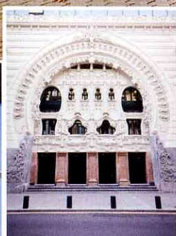
A sinistra. Il Teatro Campos Eliseo. In basso a destra. Bilborock, ex convento dedicato alla musica.

“La gente è abituata a vivere le proprie strade, come dimostra il centro pedonale Casco Viejo”