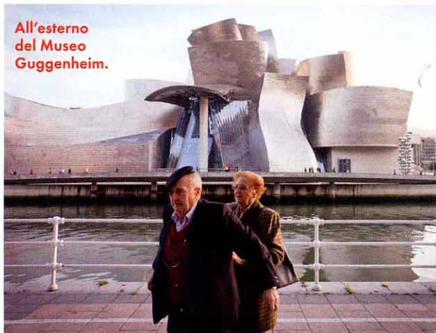
All'esterno del Museo Guggenheim.

“La gente è abituata a vivere le proprie strade, come dimostra il centro pedonale Casco Viejo”